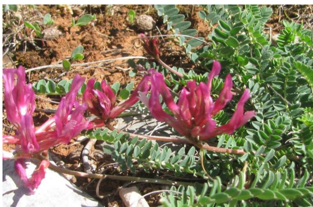
Slika 1. Biljka ilirski kozlinac Astragalus monspessulanus L. ssp. illyricus (Bernhardt) Chater.

U uvodu se navode rezultati i spoznaje drugih autora koji su predhodno obrađivali i objavili radove iz toga područja (u zagradi treba citirati autora/e i godinu; vidjeti pod Primjeri citiranja literature u tekstu). U uvodnom dijelu kao i u razradi u sklopu teksta mogu se stavljati ilustracije (grafikoni, fotografije, slike, dijagrami, histogrami, karte), koje predhodno moraju biti spomenuti u tekstu odnosno u rečenici (npr. vrsta Ilirski kozlinac je endemična biljka (slika1), a pripada određenom životnom obliku (slika 2). Broj slike i opis slike idu ispod slike. U zagradama iza opisa slike treba navesti izvor odakle smo preuzeli sliku.